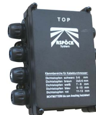
niedrig / small