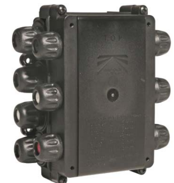
hoch / high